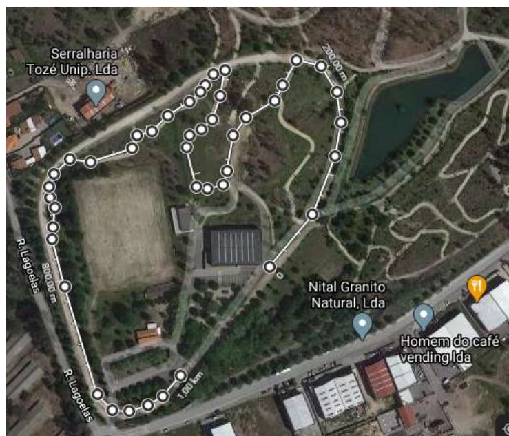
Volta Pequena (1 KM)

8 - Os percursos alternarão entre 2 voltas distintas, denominadas como "Volta Pequena" (com uma extensão de aproximadamente 1000 metros entre a partida e a meta) e a "Volta Grande" (com aproximadamente 2500 metros entre a partida e chegada). O troço do percurso entre a partida e chegada é de aproximadamente 150 metros.